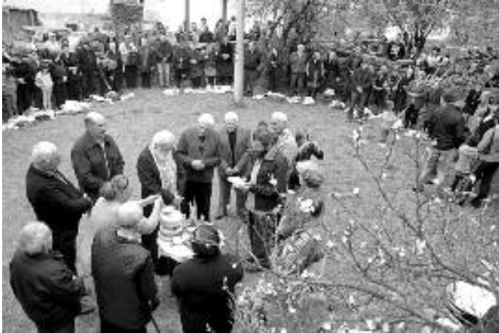
Сл. 109. Сеоска слава у Дојкинцима