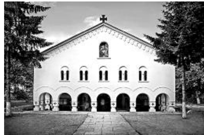
Сл. 56. Стара црква у Пироту

Свуда је господин епископ достојанствено, мирно и светиљски као првосвештеник учио, саветовао, и корио благо, тако да су сви без разлике са задовољством тражили и слушали свога Владика и одушевљено поздрављали његове речи и поуке. И сам Владика је јавно испољавао задовољство због срдачног сусрета са народом и свештенством, те је одмах на лицу места одликовао многе свештенике и народу давао јавне писмене похвалнице а деци делио масу крстића за успомену на њиховог владикау.