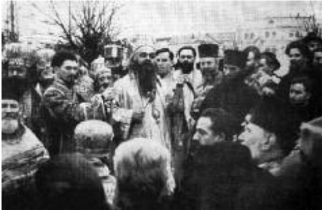
Сл. 55. Свети владика Николај у Нишу у време конкордатске кризе