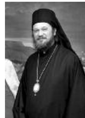
Сл. 75. Вл. нишки Јован II

На свакој стопи, свуда где сам слушао о њему, било оне који су рукоположени његовог десницом или оне које је оставио иза себе као своју духовну или телесну децу, људе који су мене, његовог имењака, прихватили као свога, свугде сам осетио духовни зов и призив, па и његов благослов. Он је био пре патријарха Иринеја и дуго је столовао, оставио је велики печат у овој епархији. Бог му је дао дуг и испуњен живот. Како је њему у то време било то само он зна, какав је крст носио, поготово у временима тешким, тескобним, у време ратова балканских, Првог и Другог светског рата, у тешком периоду између два рата. Скоро сам прегледавао Гласнике српске православне Цркве, једно двадесет, тридесет година, увече сам прелиставао, и сећајући се њега, наиђем на један пре-