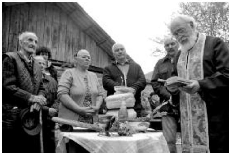
Сл. 102. Сеоска слава у Дојкинцима

се не каје за своје погрешке или не изражава своју благодарност за учињено му добротинство. Такви су управо хришћани који се Богу не моле. ... Као што сталним међусобним односима између детета и родитеља, дете стоји под њиховим сталним утицајем и они га у животу руководе, тако хришћанин молитвом одржава тесну везу с Богом Који га у животу прати, управља и помаже. („О молитви”, 1939.)