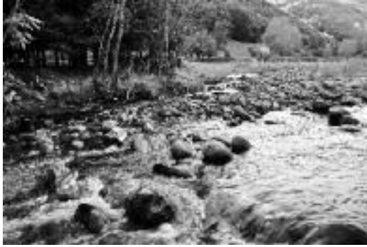
Сл. 6. Ток Височице надомак села Дојкинаца