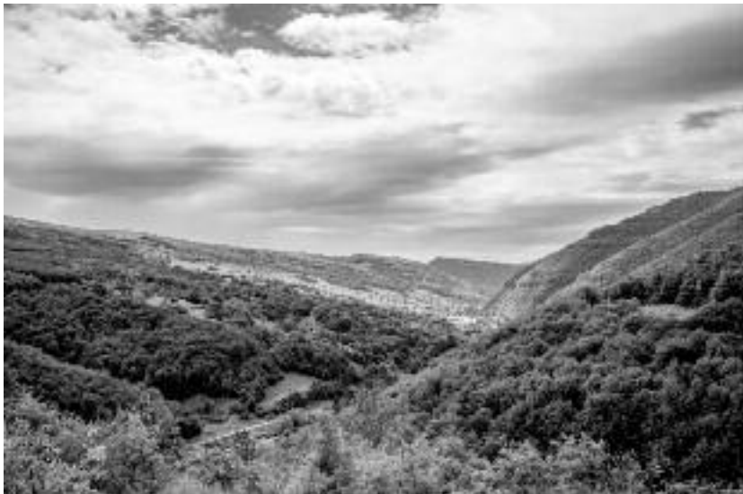
Сл. 1. Поглед на село Дојкинце из даљине