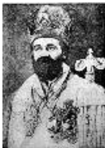
Сл. 13. Свети Доситеј Васић као нишки епископ