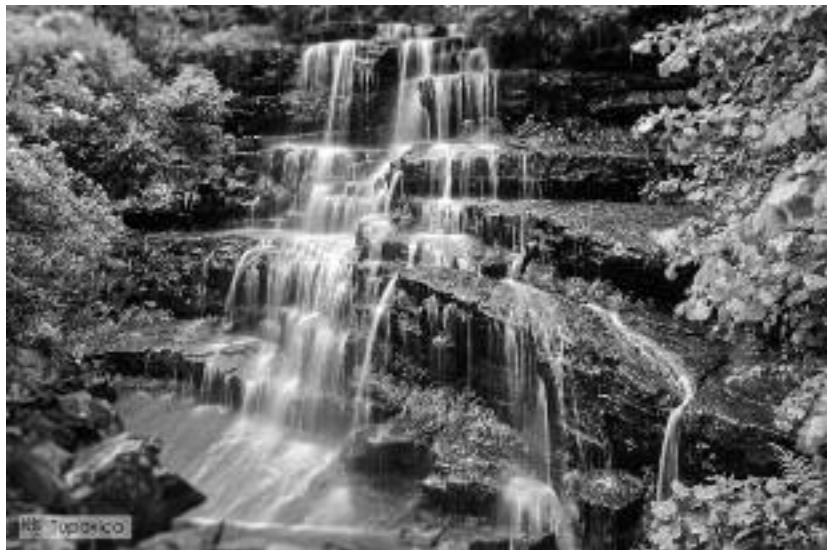
Сл. 94. „Из љубави је Бог створио свет и човека”. Водопад Тупавица у близини владикиног родног села

Снага љубави је неизмерна и она је та која треба истински да добро регулише односе. Она негира насиље, ропство, материјалне препреке, економску зависност, родбинске привилегије итд. Она је снага чисте душе изражена у подношењу насиља без гњева, мирно и узвишено праштање нанесених увреда. Она је сила коју љубав ствара и која уистини побеђује зло. Гњев заслепљује а мржња иде упоредо са свирепостију. То су силе које руше живот. Али оне не само да руше живот и разједају личност, него је убијају