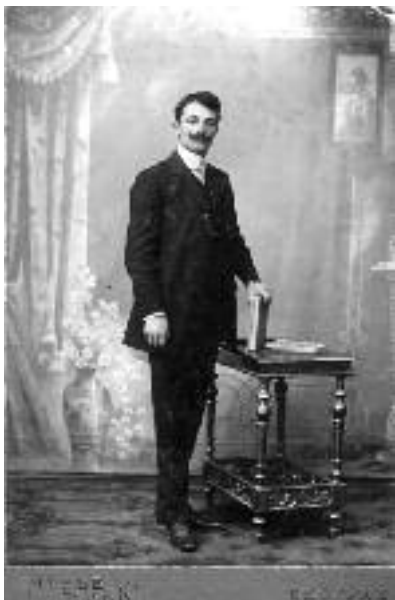
Сл. 9. Јордан као млади учитељ

Млади богослов није могао одмах да постане свештеник јер је у то доба важило правило да се рукоположење не обавља пре навршених 25 година живота. До испуњења овог услова Јордан постаје учитељ по забаченим старопланинским селима Завоју, Каменици, Дојкинцима и Рсовцима, где се на учитељским позицијама често сусретао и смењивао са својим братом, големим Јорданом. У том периоду је одслужио војни рок са кога се вратио у октобру 1906. године, као пешадијски поручник у резерви.