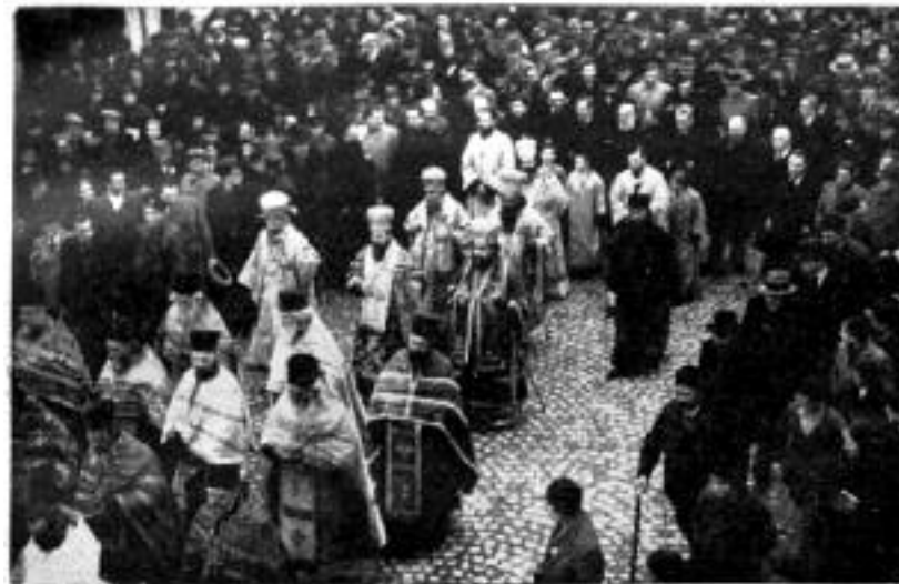
Сл. 47. Трг краља Милана у Нишу и детаљ са свечаности поводом двадесет и две године од страдања свештеника нишке епархије