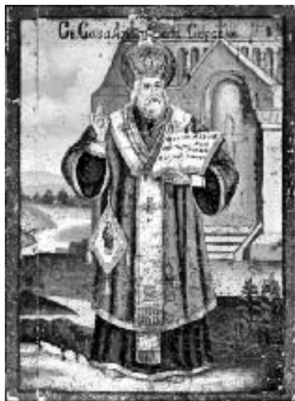
Сл. 42. Целивајућа икона Светог Саве из Старе цркве у Пироту