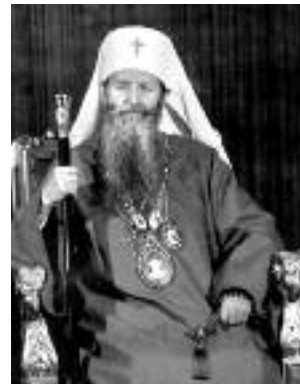
Сл. 74. Патријарх Герман

„После 91 године живота, 64 године свештеничке, односно 49 година архијерејске службе, завршио се овоземаљски животни пут Епископа нишког Јована.