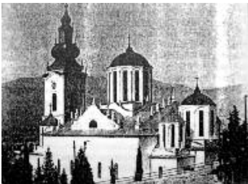
Сл. 22. Саборна црква Свете Тројице. Запаљена и до темеља порушена јуна 1992. од стране исламских екстремиста.

Две су чињенице у организму Цркве: јерархија и верни. Као што смо видели, успех Цркве зависи од једне и од друге чињенице а нарочито од њихових међусобних односа. Мада су њихови односи уређени канонима, црквеним законима и другим одредбама, ипак се не могу лепше представити но што је описано у јеванђељској причи о добром пастиру и његовом стаду (Јов. 10, 1-17), где се између осталог вели: „Ја сам пастир добри и знам своје и моје мене знају” (Јов. 10, 14). Дакле, добар пастир познаје своје стадо, али и добро стадо познаје свог доброг пастира. Пастир познаје своје стадо што му оно поклања поверење, чује његов глас и следује му; он га познаје по Духу Светом, који оно има у себи, јер ко нема Духа Христовог тај није његов (Рим. 8, 9.); познаје га по побожности, по оданости Божјој вољи, по истинитости, по праведности, поверљивости, милосрђу, стрпљењу, савесности, верности и по свима хришћанским врлинама. Све што је добро, племенито, чисто, свето служи као знак по коме добар пастир познаје своје стадо. Други знаци не долазе у обзир. Стадо ипак познаје свог доброг пастира по свом Божанском пореклу,