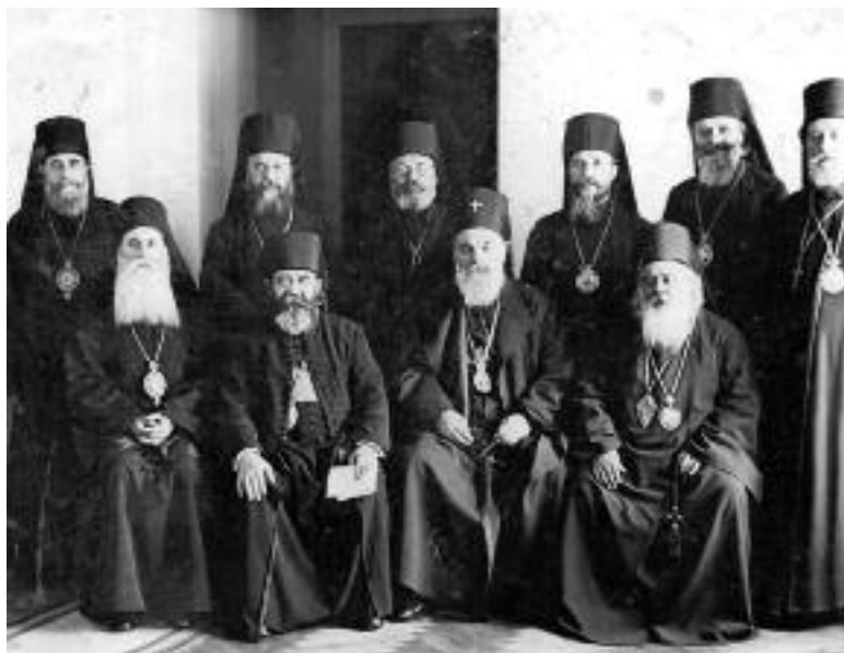
Сл. 46. Српски архијереји пре Другог светског рата.