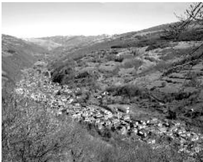
116. Село Дојкинци данас