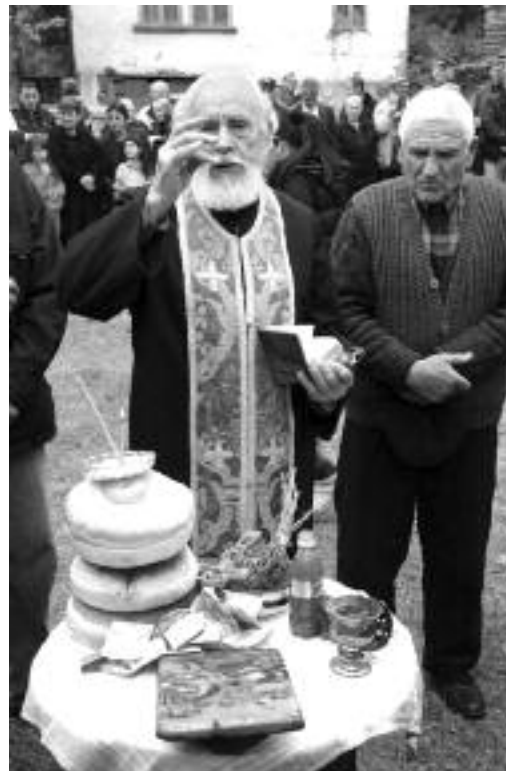
Сл. 103. Сеоска слава у Дојкинцима

друго но то, да су душе појединца без мира, да су срца појединаца препуњена немиром, да у њима станује, њима влада злоба, сукоб и узнемирење; да су мисли њихове затроване осветом и узнемирењем. Када би пак срца људска била испуњена миром, онда би и станови људски постали палате. То ће рећи: Унутарњи мир душе, срца, мисли и осећања дејствује на спољашње односе људи и њихове друштвене односе. Мир у срцу значи мир у дому; мир у дому значи мир у друштву, народу, држави и човечанству. Кад би људи имали душевног мира, они би све имали. („Христос Миротворац”, Ср. Карловци, мај 1940.)