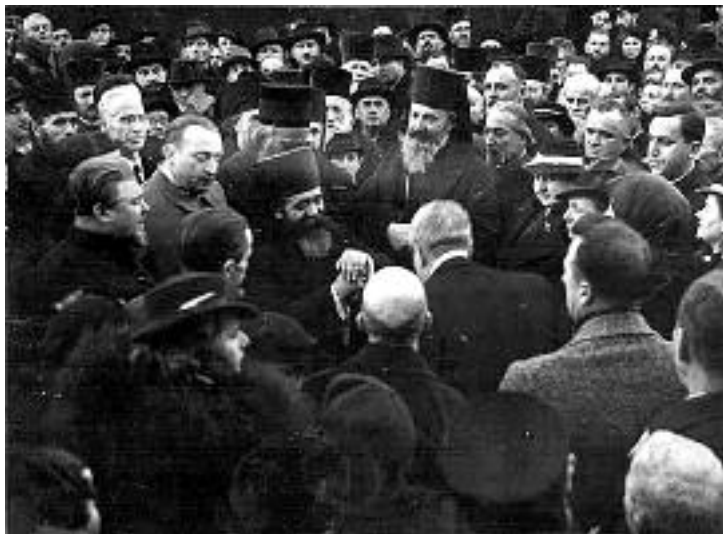
Сл. 57. Пастири и верни народ против унијаћења у Нишу крајем 1937. год.