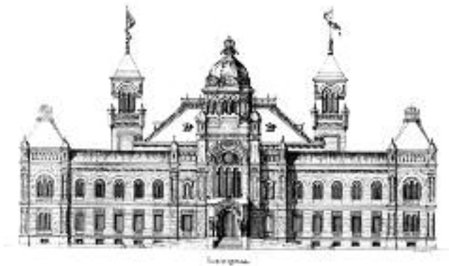
Сл. 51. Нацрт владичанског двора у Нишу