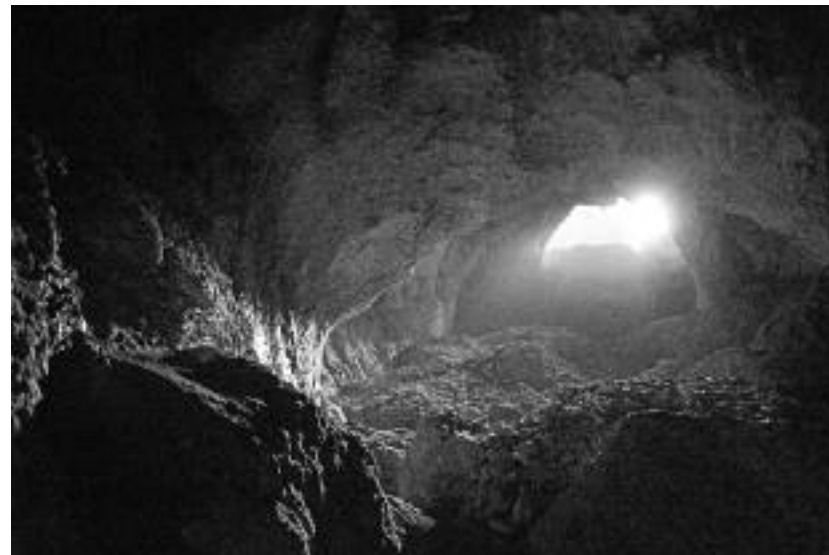
Сл. 97. И сами топоними говоре о побожности Височана. На слици је пећина „Владикине плоче” у атару Рсоваца, родном селу владикине мајке Маруше. Сама клисура изнад које се налази пећина носи исти назив,

гробља која су већа од наше државе. Ако не буде тако, рани мученици ће нам рећи: „О недостојни, ми пре времена одосмо у смрт за слободу коју ви за живота упрљасте!” Ако не буде тако, милиони наших предака који се у ропству одржаше као светли карактери рећи ће нама: „О прокажени, ми у ропству бејасмо слободни, а ви у слободи постадохте робови!” (Божић 1937.)