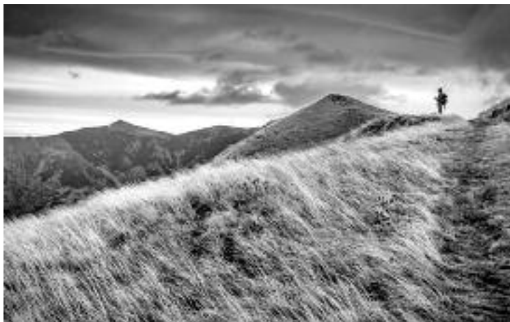
Сл. 93. „Тежња ка вечном никада неће умукнути”. Стара Планина, испод Жаркове чуке