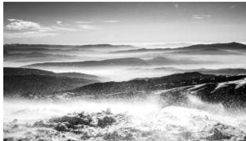
Сл. 45. Поглед са Миџора

Из Завоја се пошло за село Топли До, испод самог Миџора, круне Доњег Висока. Само око човека који живи у питомим равницама наше лепе домовине може да осети лепоту овога краја и многих пејсажа који сужавају хоризонт, али зато дају погледу дивно и пријатно одмориште. Пуни дивљења прошли смо кроз најлепше крајеве источне Србије. Нарочито је био интересантан прелаз преко романтичног Мртвачког моста. Многобројна шумљена брда, чији су врхови парали небо, била су гдегде покривена стадима чувених височких оваца, што је нарочито давало чар и лепоту и тако лепим пределима. На једној ливадици изненадили су нас грађани села Засковца, који су, чувши да Владика пролази иако је био радан дан, иако су пољски послови били у јеку, изашли листом да поздраве срдечно свога Архијереја. После водоосвећења и говора Архијереја продужило се за Топли До. Праћен својом личном пратњом, са 50 коњаника, Архијереј је веома свечано ушао у лепо планинско село Топли До, поздрављен веома срдечно од народа. Село је било искићено цвећем и разнобојним ћилимима. Пред врло лепом црквом Архијереј је захвалио на лепом дочеку и кроз лепу реч показао како добар пастир чува, како се брине о стаду, указавши на многе лажне учитеље, који својим настраним идејама руше све оно што је најдра-