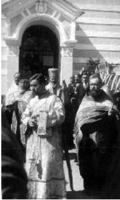
Сл. 49. Владика испред Беле Куле

његовом задужбином. Може се хвалити својим владиком Мелентијом и његовим друговима. Могао би бити чак и охоли својом „Белекулом“ Синђелића. Најзад, може бити и разметљив својом костурницом патриотског свештанства. Све то он може бити, јер све побројане знаменитости су ознаке његовог карактера, његове побожности и његовог патриотизма, храбрости, пожртвовања и порекла. Но, наш град а још мање народ нишке Епархије није горд, већ скроман, јер ми знамо да је гордост фарисејство и порок, није хвалисав и разметљив, већ је ћутљив и повучен, није охол него вредан и штедљив, побожан и благочестив, чувар својих тради-