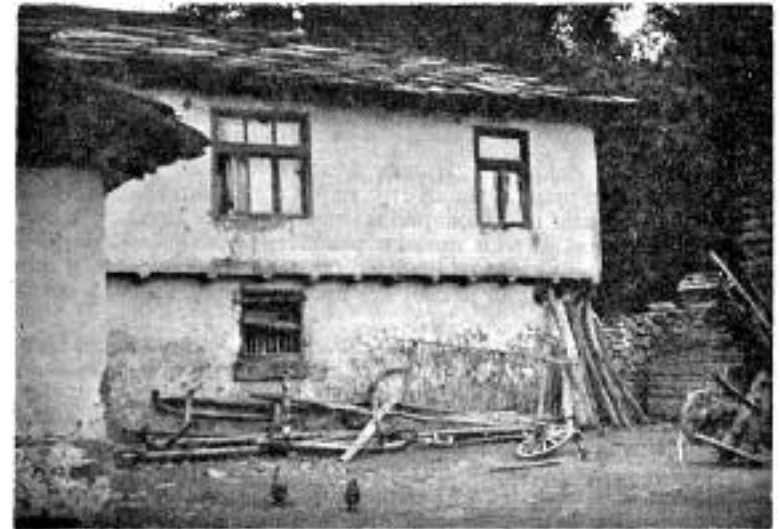
Сл.7. Родна кућа владике Јована

Мој покојни отац свршио је све тадашње школе. Знао је многе молитве напамет. Знао је цео `Часловац` и `Псалтир` напамет. Знао је, слободно могу тврдити, много више него што су знали многи свештеници тадашњег времена. Умео се снаћи у свим приликама и друштвима. Зато је био умешан и при молитви. Молио се Богу и ујутру и увече, и при кретању и при свршетку посла. Није се он само крстио и метанисао, него је увек читао молитве и псалме и певао тропаре недељне или празничне. Чим устане ујутру, одмах се умије, а затим припали свећу пред иконом и прочита своју дневну молитву. Овако је радио и кад је био на путу или отишао рођацима у госте. Но, мени су и сада у живој успомени његове дугачке молитве уочи недеље, славе и великих празника. Тада су пре вечере били сви укућани на окупу стојећи пред домаћим иконостасом. Пред почетак он, као домаћин, ока-