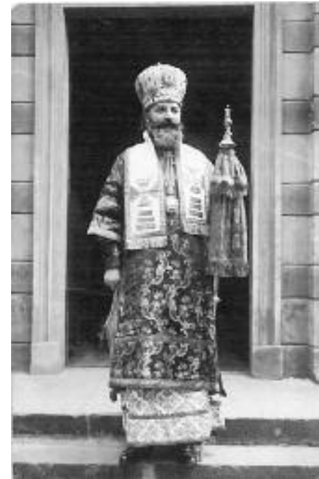
Сл. 26. Владика Јован у Пожаревцу

„Први мој поглед овог свечаног момента управљен је небу. Прве моје речи, када ступам на катедру епископа браничевских, упућене су горе – Богу: да Му заблагодарим на досадашњој превеликој милости Његовој, коју је штедро излио на мене почевши од рођења до данас и у току мог дугогодишњег јавног рада и уздигао ме на највећи степен црквене јерархије; да га умолим да ме и даље подржава својом моћном десницом да не потонем на огромној пучини архијерејских дужности, да не пустим у немар таланат и дар који ми је поверен (1. Тим. 4, 14), него да ми помогне да мој рад у Цркви Његовој могу развити са највећом енергијом и готовошћу на корист наше Св. православне Цркве, Св. арх. сабора и наше Отаџбине.”