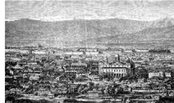
Сл. 29. Стари Ниш

Горди град Ниш, наша резиденција је не само од најдревнијих места у нашој Отаџбини, него је место које је од најстаријих времена имало значајну улогу. Он се може поносити не само својим старинама и својом прошлошћу него још више својом знатном улогом у свим временима. Он је не само град првог хришћанског цара Светог Константина и његове мајке Свете Јелене, него је град славних Немањића. Он је град храбрих Синђелића. У њему је не само црква Немањића, него су у њему „Беле кула” Синђелића и