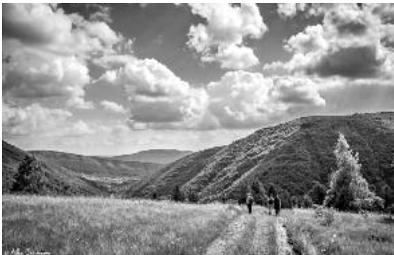
Сл. 41. Стара планина, спуст ка Сенокосу