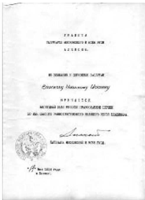
Сл. 39. Грамата захвалности коју је владика Јовану ручио руски патријарх Алексеј 1958. године