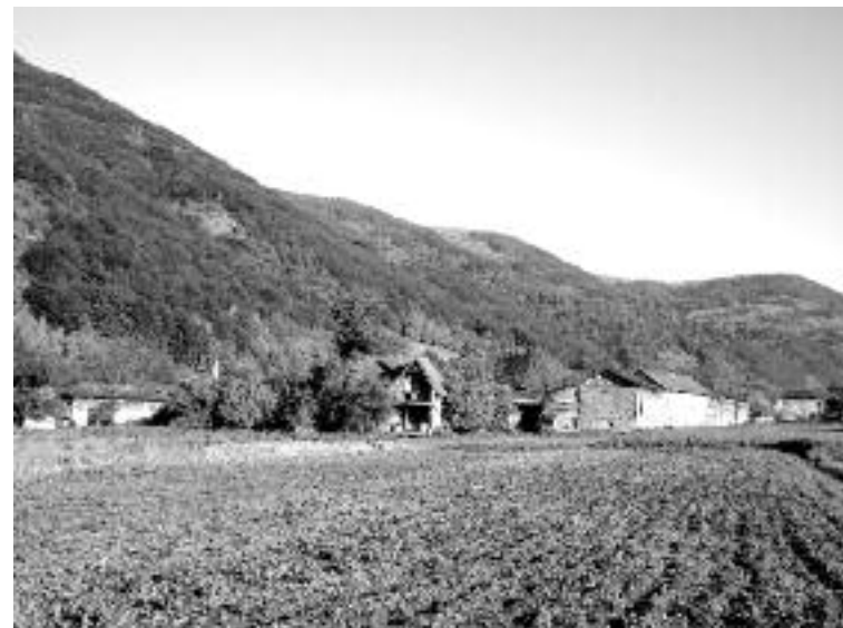
Сл. 106. Лилђине њиве

Тешко доброчинству у коме се човек хладним новцем откупљује од истинитог милосрђа. Тешко доброчинству, ако га ко чини да би био поштован. Тешко милосрђу, где се за дела милосрђа приређују веселе забаве, када се за сиромашне и невољне у укусно намештеним салама игра или ужива у разним телесним страстима. („Блаженство милостивих“)