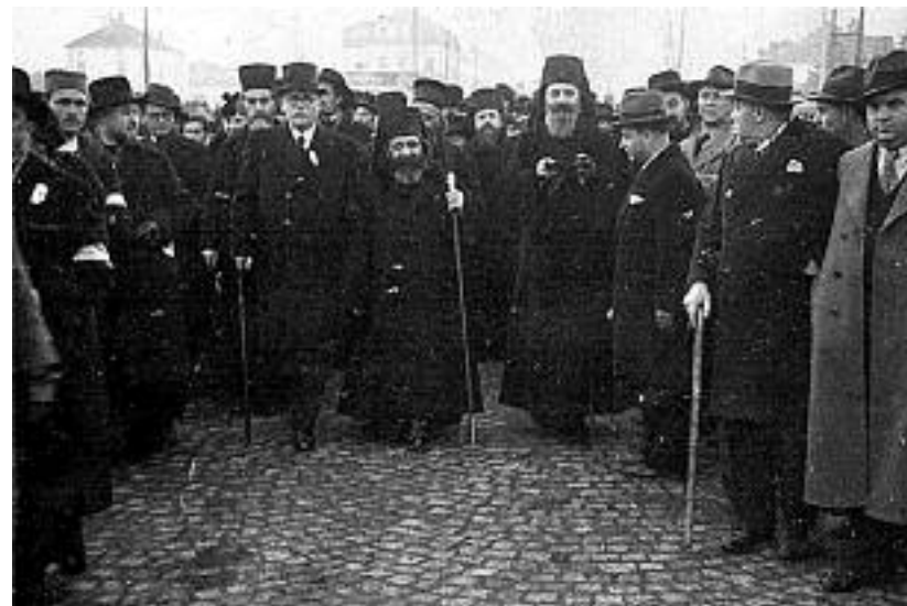
Сл. 48. На помену свештеномученицима у Нишу била су и два света архијереја: Свети Доситеј Загребачки и Свети Николај Жички

Истина да и то, што са радошћу можемо константовати да су највећи непријатељи нашег народа и државе сада постали наши пријатељи и савезници, те не треба да поново распаљујемо мржњу и неслогу међу суседима. Али да ли смемо заборавити на жртве, поднете за победу нашег народа и остварење наших идеала? Да ли смемо заборавити на оне факторе који су највише допринели да наш народ сачува своју народност? Да ли смемо заборавити жртве поднете за одржавање наше нације, за стварање наше народне државе? Да ли смемо заборавити улогу коју је имала наша Српска православна Црква у нашој историји, на жртве које је наше народно свештенство, наша народна јерархија принело за Цркву, веру, народ и Отаџбину? О, не! Како бисмо ми Нишлије могли заборавити првог хришћанског владоца св. цара Константина, који се овде родио? Како бисмо могли заборавити св. Симеона, оца св. Саве, који је овде имао своју задужбину? Тако исто не можемо и не смемо заборавити владика Ме-