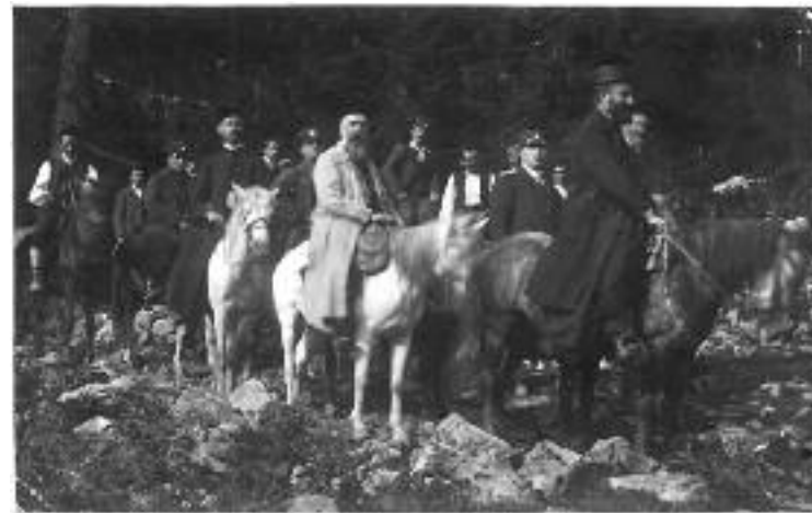
Сл. 24. Путовање по Херцеговини, на путу из Чајнича за Заборак, септембар 1926. године

„Путујући по епархији у разговору с вама дознао сам да и ви мрзите неслогу, раздор и свађу. Па кад их мрзите, ви их и одбаците и оставите све рђаве страсти и навике које руше слогу и ометају напредак. Сложни, измирени и збратимљени на дан Воскресења Христова приђимо и поклонимо се васкрслем Спаситељу. Поклонимо му се и помолимо се Оцу, Сину и Светоме Духу: да нас обасја својом светом вером и љубављу, да утврди мир и слогу међу нама, да нам опрости грехе наше и да нас исцели од гордости и сваке злобе. Поклонимо му се и један другог поздравимо: Христос воскрес! Амин!“