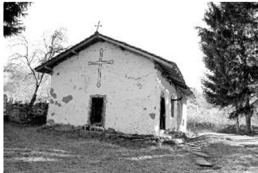
Сл. 5. Древна црква Светог Николе у Дојкинцима

Ова стара богомоља посвећена је Светом Николи. Укопана је и озидана од грубо тесаног камена јако давно, у 15. или 16. веку. До ње се долази проласком кроз припрату која је израђена од блата и омазана белим кречом средином 19. века. Силаском кроз узана врата и два степеника, стиже се у унутрашњост храма чији су зидови фрескописани занимљивом серијом из Страсне недеље Христовог страдања, Васкрсења, Страшнога суда, као и необичном представом светог Христифора са пасјом главом. Храм је осликан крајем 19. века а видљиви су слојеви страјих фресака као и трагови паљена, вероватно из времена Крцалија.