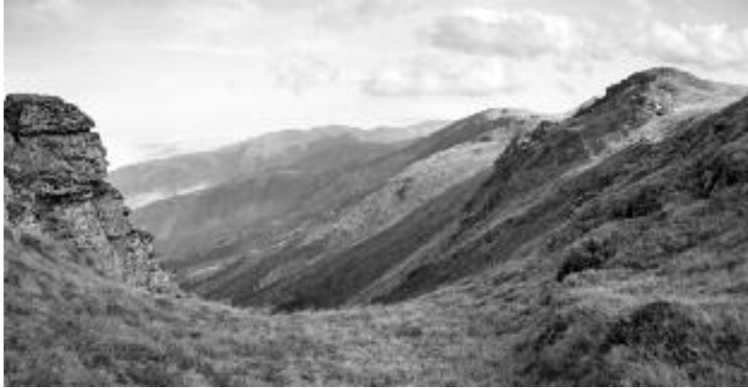
Сл. 107. Врхови Старе планине