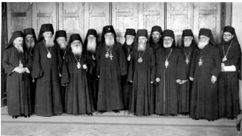
Сл. 63. Српски епископи са патријархом Гаврилом у Београду 1947. године