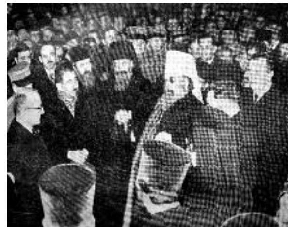
Сл. 50. Патријарх Гаврило у Нишу на откривању споменика краљу Александру децембра 1939.

националној цркви као најбољој учитељици нашега народа у прошлости. Ако човек хоће да зида кућу, он тражи доброг и опробаног мајстора. Ако хоће да погађа слугу, тражи да је добар и из добре куће и да је већ добро служио. Кома да се ми обратимо у мутној данашњици и кога да узмемо за учитеља, ако не нашу Српску православну Цркву, која нас је и до сада учила и сачувала у свима минулим вековима. „Сви учитељи који иду у своје име а без Цркве нису прави учитељи и не могу нас у данашњици спасити и научити, до једино српска Црква са њеним свештенством”, завршио је Преосвешћени свој говор, који је на присутне оставио дубок утисак. Праћен коњаницима у прекрасној народној ношњи, Преосвешћени је наставио пут за Расницу, где је имао да се обави главни део свечаности. Улазак Преосвешћеног у село објављен је прангијом и звоњењем звона. Цео пут од средине села до цркве био је прекривен цвећем, по коме је корачао Преосвешћени. С једне и друге стране био је шпалир ђака из Б. Чифлика, Раснице и Пасјача и мноштво света, који је прилазио и љубио свету десницу своје Владике, кога први пут види у својој средини. Био је прави мрак, када је Преосвешћени ушао у двориште цркве, где га је чекала литија са барјацима. На јектенијама врло складно одговарао је ме-