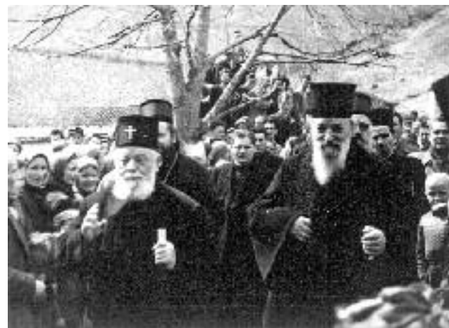
Сл. 67. Са патријархом Викентијем у Македонији 1958.