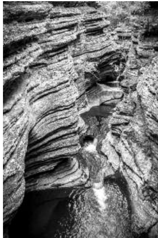
Сл. 99. Чудесна клисура „Лонци” или Росомачко (Славињско) грло у Високу

Многим је нејасно: како је васкрсли Господ победио грех, а људи и сада греше, како је Христос победио смрт, а људи и сада