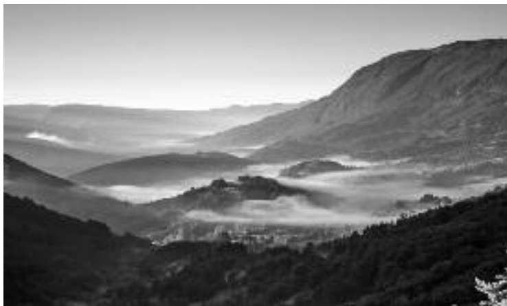
Сл. 4. Поглед на долину реке Височице