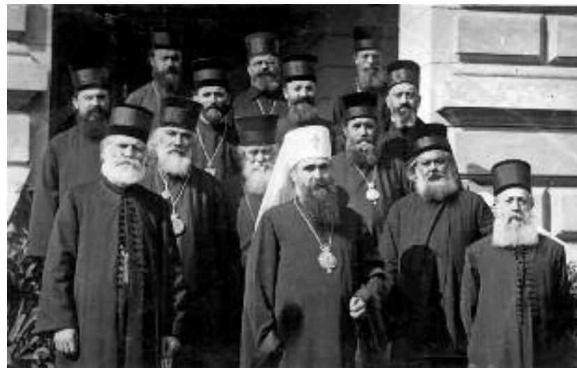
Сл. 30. Слика са Светог архијерејског Сабора. Млади владика нишки Јован стоји изнад патријарха Варнаве.

Из ових разлога задаци наше Цркве, нашег свештенства и наших верних синова и кћери, а зато и наша служба у данашњем