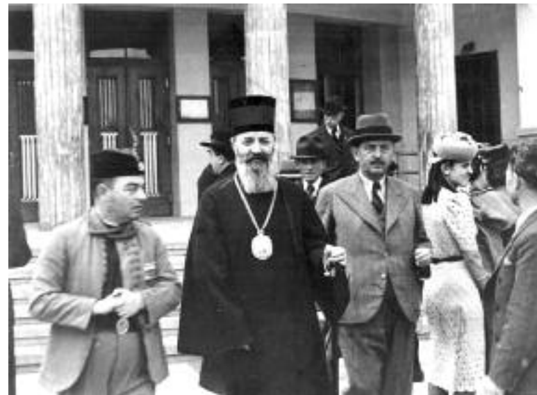
Сл. 38. Испред Народног позоришта 1940. са прославе Соколске жупе у Нишу