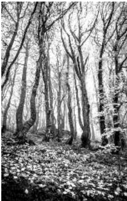
Сл. 91. Детаљ са Старе планине

Дужност послушности деце према родитељима одговара родитељској власти. Грех непослушности деце према родитељима толико је већи уколико су деца одраслија, разумнија, зрелија и уколико њим руши кућни поредак, васпитање и мир у фамилији. Ако би се код одрасле деце појавила мисао противна заповести родитеља, она им се неће урачунати у грех, ако је учтиво објасне и с поштовањем родитељима предложи. Не би биле обавезне само