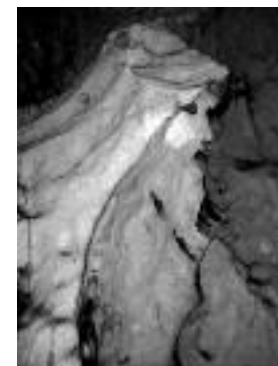
Сл. 98. Детаљ из пећине. Природна статуа која са налази на 300 метара од улаза у пећину.