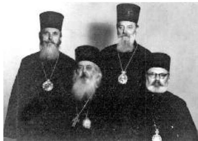
Сл. 58. Владика нишки Јован у „ратном Синоду”

„У току Другог светског рата он испољава сву своју способност и храброст достојну једног пастира Цркве Христове. Као члан светог Синода и као познавалац немачког језика и културе, он одлази команданту немачких снага за град Београд и успева да издејствује да се из Патријаршијске зграде иселе војници који су је били окупирани и узурпирани. /.../ Оно што свакако заузима значајно место у његовом ангажовању у време рата јесте рад на