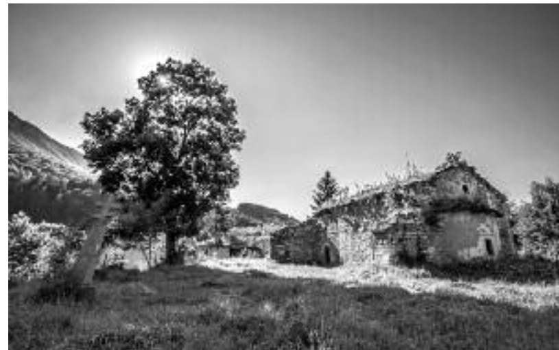
Сл. 40. Древна црква у Славињи