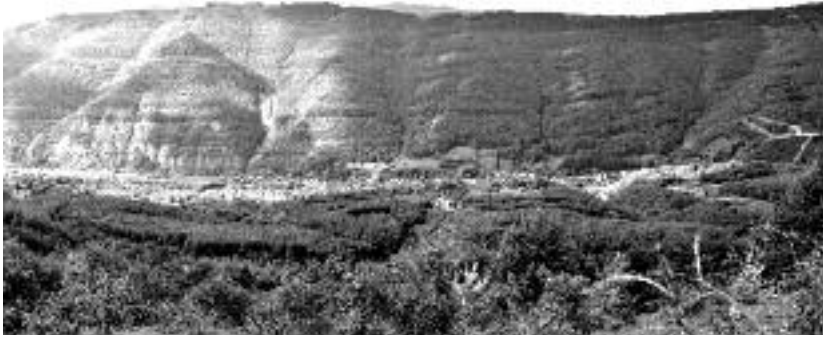
Сл. 33. Село Дојкинци