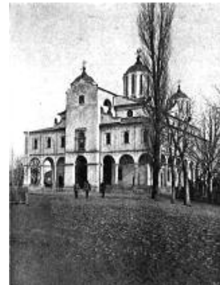
Сл. 27. Саборна црква у Нишу пре Првог светског рата