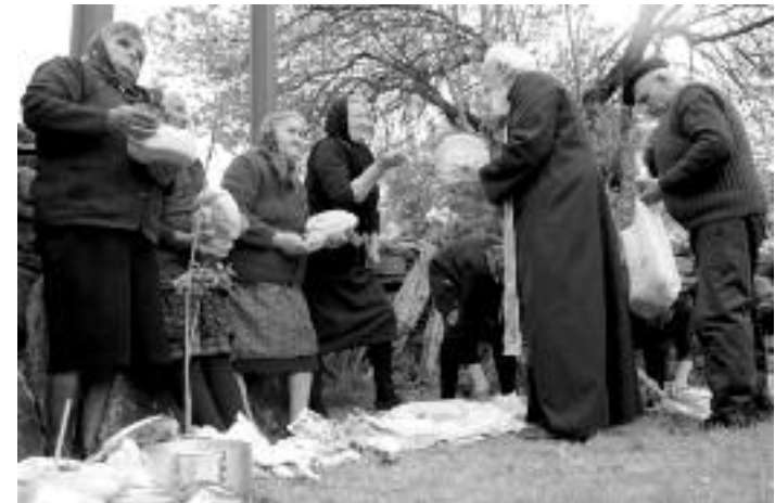
Сл. 104. Сеоска слава у Дојкинцима

Колико је Богу драга слогa, мир и љубав види се из овог примера из живота Светог Макарија Египатског. Свети Макарије прича да је једном приликом, кад се молио Богу, чуо глас: „О, Макарије, ти си Божји угодник, али се још ниси поредио светошћу и савршенством у двеју жена које живе недалеко одавде у једној вароши”. Чим старац Макарије чу овај глас, крене на пут да потражи ове две побожне жене. Дошавши њиховој кући, нађе их па их упита: „О, сестре по вери и Богу, молим вас, да ми кажете како ви живите и како Богу служите?” Побожне и скромне жене једнодушно му одговорише: „Свети старче, ми смо грешнице јер живимо у светским сујетама и бригама”. Светог Макарија овај одговор није